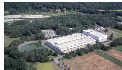
美しい川を守っています

製品をつくる栃木工場の近くにはきれいな川があります。工場を使った水はしっかり検査をして川の環境を守り、豊かな自然を残せるよう努めています。