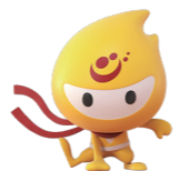
▲ジキニンイメージキャラクター:ジキ忍