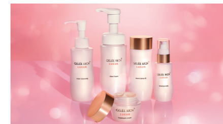
持ちやすいボトルを採用

製品をつくる栃木工場の近くにはきれいな川があります。工場を使った水はしっかり検査をして川の環境を守り、豊かな自然を残せるよう努めています。