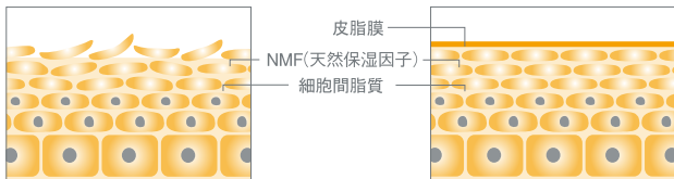
バリア機能が低下した肌の状態

様々な外敵（悪環境）にしっかり対抗できる、すこやかな肌づくりから体全体を健康に。