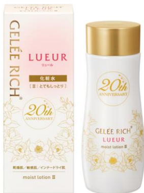
ジュレリッチ リュール モイストローションⅢ 20%増量品

全薬工業株式会社(本社:東京都文京区 代表取締役社長 橋本弘一 以下、全薬工業)は、エイジングケアブランド「ジュレリッチ」より「ジュレリッチ リュール モイストローションⅢ」の20%増量*3 サイズ、ジュレリッチ リュール モイストローションⅢとエッセンスミルクのミニサイズがセットになった「ジュレリッチ リュール 保湿トライアルセット」、またジュレリッチ エタンよりミニサイズのローション、ミルク、クリームがセットになった「ジュレリッチ エタントライアルセット」を数量限定にて発売いたします。