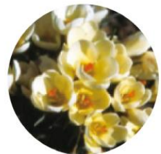
クロスクリ サンツス根エキス