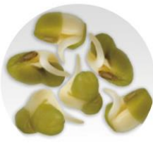
リョクトウ成長点 細胞培養エキス