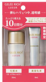
ジュレリッチ リュール 保湿トライアルセット