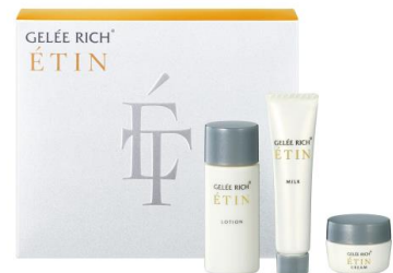
ジュレリッチ エタン トライアルセット

全薬工業は、1955年から皮膚病薬の研究に取り組み、2001年に敏感肌に悩むすべての方のための敏感肌用スキンケアブランド「アルージェ」を発売。続いて2004年にはエイジングケア発想のスキンケアブランド「ジュレリッチ」を発売、2024年の秋、ジュレリッチブランドは20周年を迎えました。