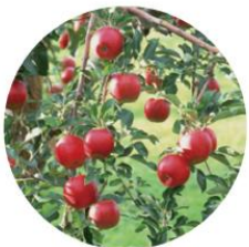
リンゴ果実 培養細胞エキス