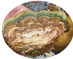
ビフィオアルギノ リチクス培養液