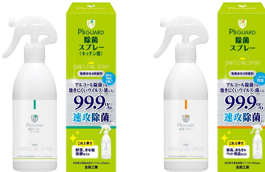
P's GUARD 除菌スプレー(キッチン用)