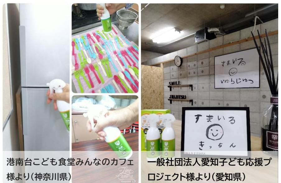
港南台こども食堂みんなのカフェ様より(神奈川県)

ピースガードシリーズを実際に使用した施設からは、「小さいお子さんがいる家庭ではさまざまなものを除菌できるスプレーは有難い。こどもたち自身で使っている（徳島県）」、「テーブルや椅子などの除菌に使用しています。薄めるといった手間もなくそのままスプレーできるので助かる。（神奈川県）」、「受け取った除菌スプレーを活動に使っているテーブルや椅子などの除菌に使っています（神奈川県）」などの声が寄せられています。