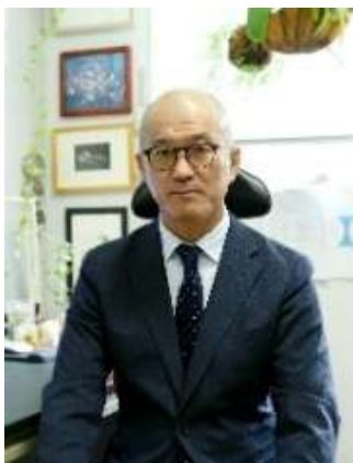
阿部 章夫 教授